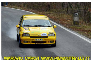
MARIANO CARON WWW.PIEMONTRALLY.IT