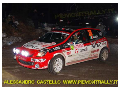
Betti-Agnese vincitori A7