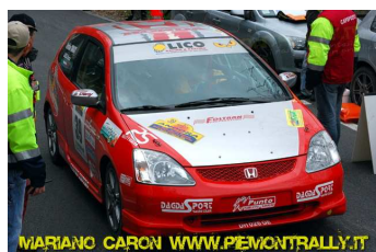
Lanza-Tumiatì vincitori classe N3