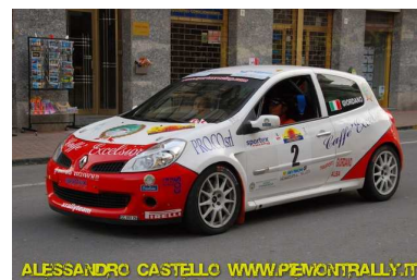
ALESSANDRO CASTELLO WWW.PIEMONTRALLY.IT