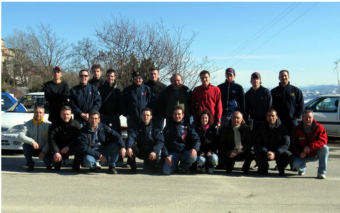
Foto di gruppo dei protagonisti del corso

Sito VM MotorTeam: http://www.vmmotorteam.it