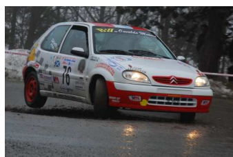
Lallaz-Scivoli vincitori classe N2