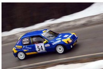
Rosano-Avidano vincitori classe FA6