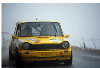
Chierigato-Coppo vincitori classe FA0