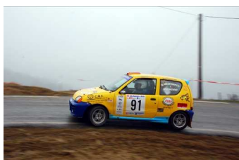
Manfrinetti-Ponzano vincitori classe A0