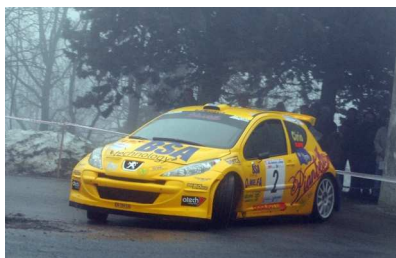
Cirio-Araspi Vincitori Ronde Canelli 2009