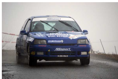
Ippolito-Penna Ronde Canelli 2009