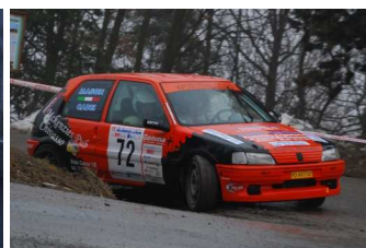
Cadei-Mason vincitori classe FA5