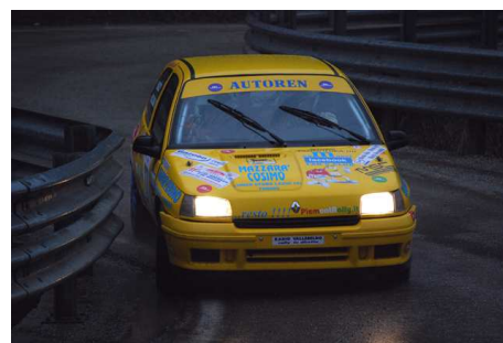
Motton-Dorato vincitori classe A7 - Mazzarà-Mazzetto vincitori classe FA7