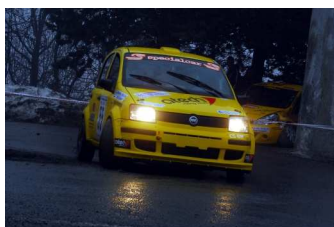
Gallo-Robba vincitori classe A5