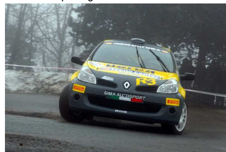
Vagnini-Piovano vincitori classe S1600 - Araldo-Boero vincitori classe R3