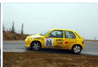
Perazzo-Basile vincitori classe FN1

Sito della Gara : http://www.asmotorsport.com