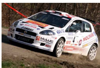
Ronde del Freisa 2009