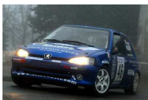
Musso-Gherlone Ronde Canelli 2009