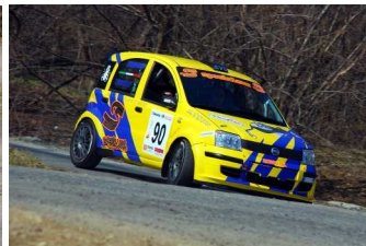
Tavelli-Romano vincitori classe A5