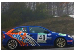
Pulvirenti-Bertin Rally Riviera Ligure 2009