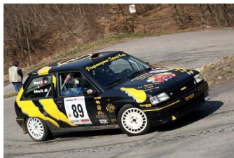
Bellonzi-Ribezzi vincitori classe FA6