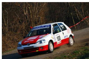
Bergo-Cerutti vincitori classe N2