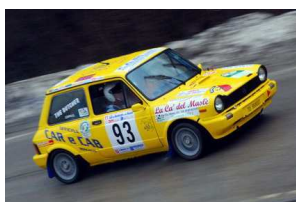
Chieregato-Coppo Vincitori Classe Ronde Canelli 2009