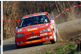
Favaro-Favaro vincitori classe FA5