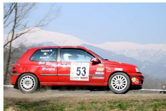
Ania-Faccaro vincitori classe FN3