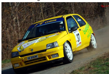
Calvetti-Conti vincitori classe FA7 - Gallo-Perino vincitori classe N3