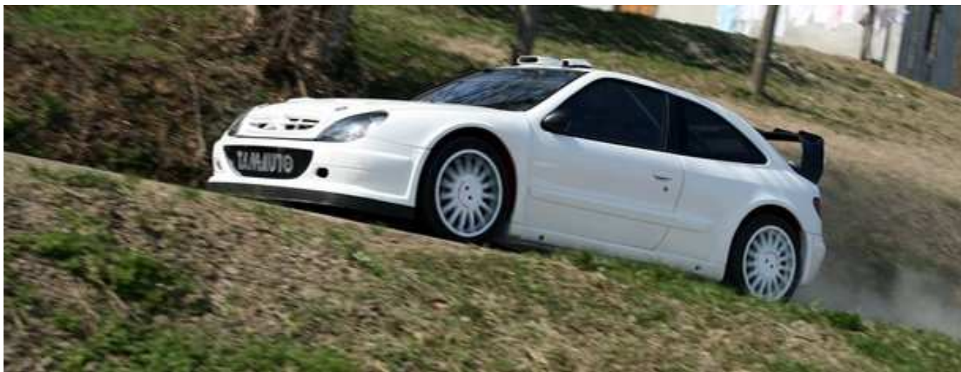
Roberto Botta in azione ai test