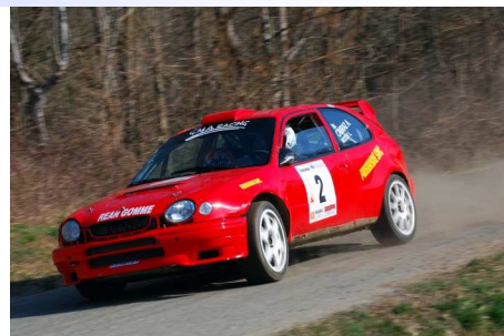
Cabraz-Rossi vincitori classe WRC