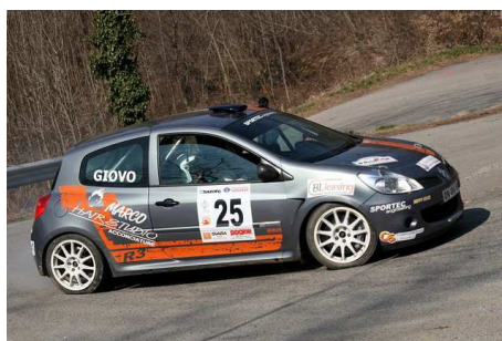
Raguso-Giovo vincitori classe R3 - Ticozzi-Colleoni vincitori classe A7