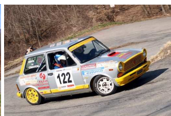
Craveri-Benedetto vincitori classe FA0