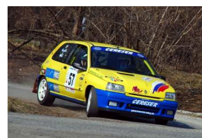
Matè-Cossetta Ronde Freisa 2009

Per commenti, critiche, idee o suggerimenti sulla NewsLetter non esitate a CONTATTARCI... news@piemont rally.it