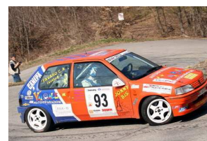
Favaro-Favaro Ronde Freisa 2009