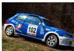
Pogliano-Vallosio Notturna Ronde Freisa 2009