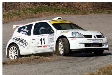
Ribaldeschi-Tessiore vincitori classe N4 - Candiotto-Mazzocchi vincitori classe S1600