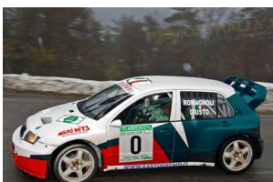
Romagnoli-Giusto Rally Riviera Ligure 2009