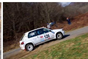
Rosset-Defrancesch vincitori classe FN1